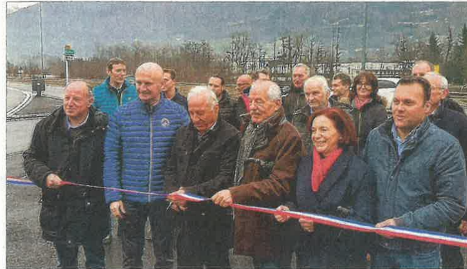
Le giratoire de Frontenex a été inauguré lundi matin.

Le budget de 630 000 € a été entièrement supporté par le Département qui a mis en place les crédits nécessaires pour la sécurité de