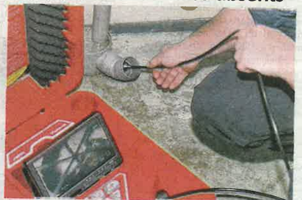
Des travaux coûteux sont à prévoir, une fois le problème identifié et résolu.

Depuis le transfert de la compétence eau aux équipes d'Arly-sère, le moins que l'on puisse constater est qu'il est très difficile de les joindre. Du temps de la délégation de service public, c'est Suez qui réceptionnait directement les appels. Depuis le 1er janvier, c'est la communauté d'agglomération Ar-