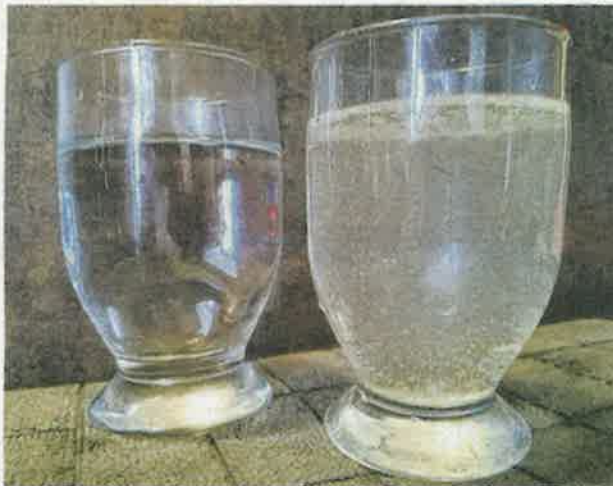
Si l'eau paraît blanchâtre, sa qualité est malgré tout bonne

Depuis le 1er janvier 2018, les compétences eau et assainissement ont été intégralement transférées à la Communauté d'Agglomération Arlysière. Comme pour tout prestataire, il est tenu à un service de qualité. Pourtant, en Haute Combe de Savoie, les coupures d'eau sont fréquentes. Interrogés sur le sujet, plusieurs habitants ne cachent pas leur agacement : « Coupure vendredi dans la nuit, dimanche dans la nuit... Enfin bref, tout le monde s'en fout. Ça fait depuis 2011 qu'on leur dit que y'a un problème mais personne s'en occupe. Par contre pour payer les factures, ils te rappellent dans la semaine ». A priori, ces coupures ne sont pas liées à de la maintenance puisque dans toute la mesure du possible, l'exploitant informe des interruptions du service quand elles sont prévisibles. Interrogé sur le sujet, le service des eaux d'Arlysière a tenu à apporter quelques précisions : « Le prestataire Suez a effectivement été averti d'un défaut d'alimentation le 22 janvier sur ce secteur de Frontenex par une alerte en télégestion de surconsommation. Après s'être rendu sur place, ils ont effectivement une consommation bien trop importante. Normalement cela est dû à une fuite mais après recherche, ef-