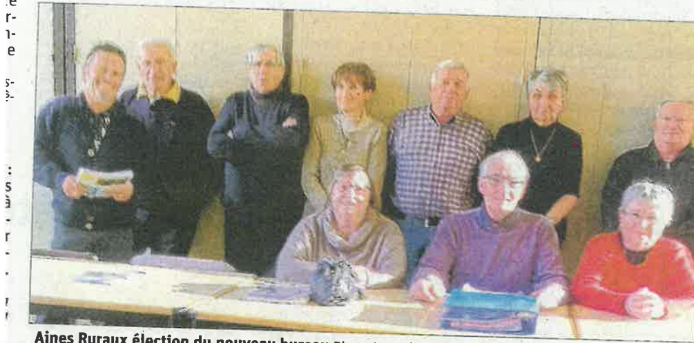
Aînés Ruraux élection du nouveau bureau

Les Aînés ruraux de Frontenex ont eu leur première réunion du nouveau conseil d'administration à la Maison des sociétés.